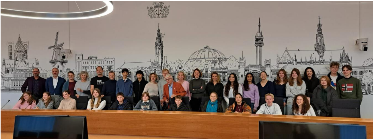
De Jongerenraad 24/25 in de raadszaal.